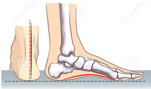
1. Voûte plantaire d'un pied normal

Le pied normal comporte une cambrure interne et pas de cambrure de l'arche externe.