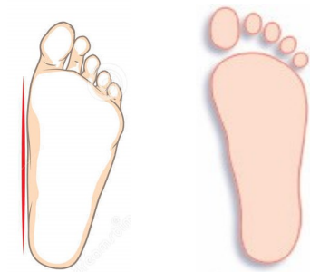
2. Empreintes d'un pied plat