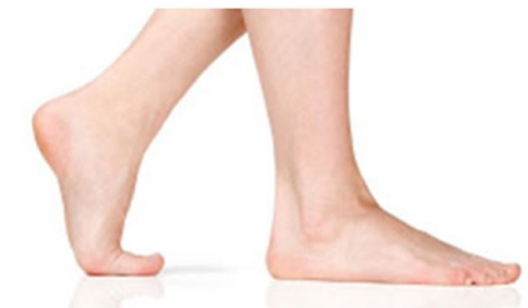
3. Photo de profil d'un pied plat